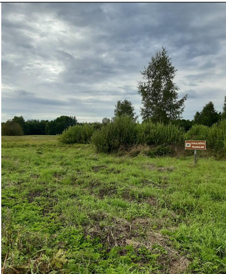
Kultūros vertybių kodas 24111