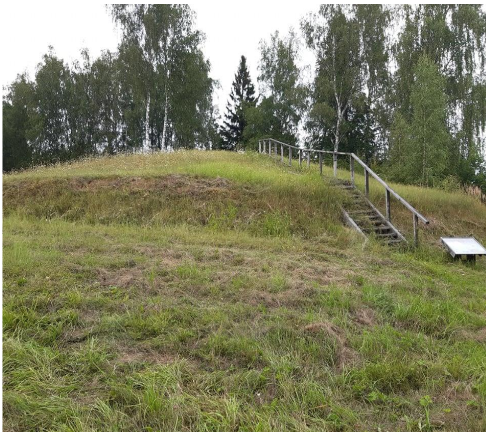
Kultūros vertybių kodas 24111